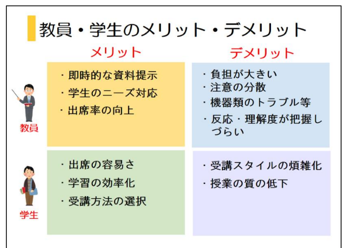
図1 教員・学生におけるハイブリッド授業のメリット・デメリット（文学部FD研修会資料より）

これらの長所と短所の検討結果からハイブリッド授業の特性として次のことがあげられる。それは、対面授業とオンライン授業の両方の授業形態の長所を保持しているということ、ハイブリッド授業は図2のようにオンライン受講と対面受講の2種の受講形態が混在するため、教員は対面とオンラインの2種の場の授業をそれぞれ円滑に進めなければならないという特徴である。