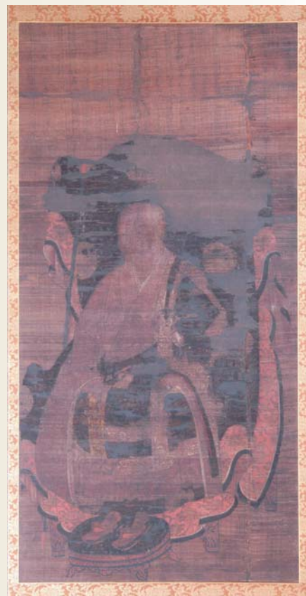
永正元(1504)年 絹本着色開山神嶽通龍禪師頂相 (山梨 永昌院蔵 <山梨県指定文化財>)