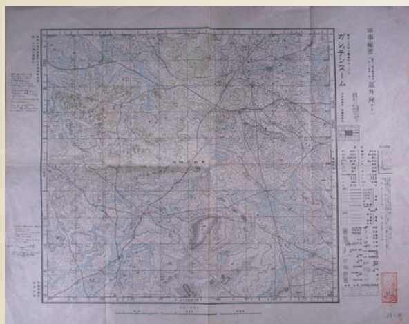
外邦図(モンゴル ゴビ沙漠の地形図 昭和16年参謀本部発行) (本学図書館蔵)