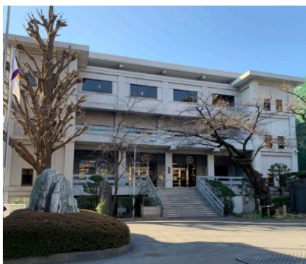
駒沢キャンパス 禅研究館

7/30より、社会連携センターの事務室が「禅研究館3階 307室」に移転します。