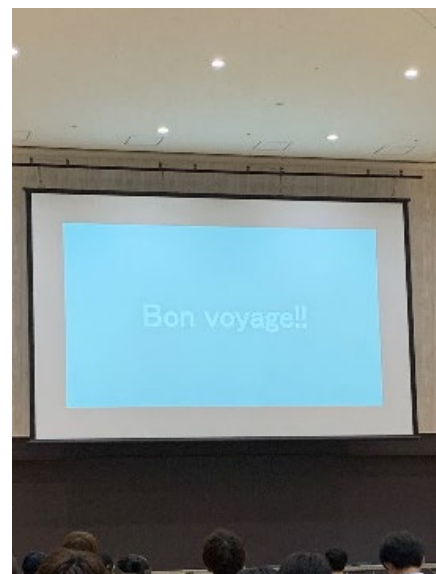
現代応用経済学科1年生に に向けたメッセージ フランス語で「よい旅を！」

7/30より、社会連携センターの事務室が「禅研究館3階 307室」に移転します。